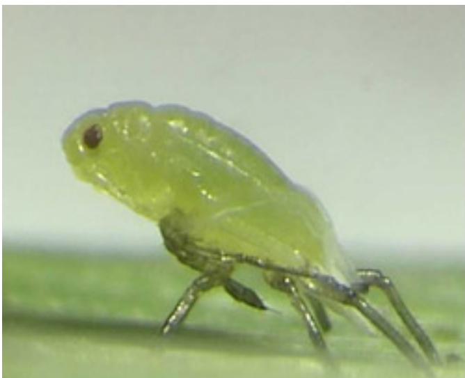
Blattlaus bei der Häutung zum nächsten Larvenstadium