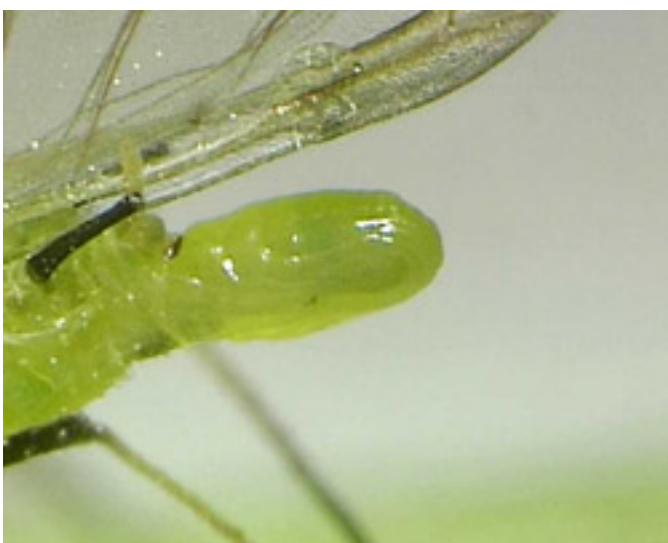
Geburt einer Blattlaus