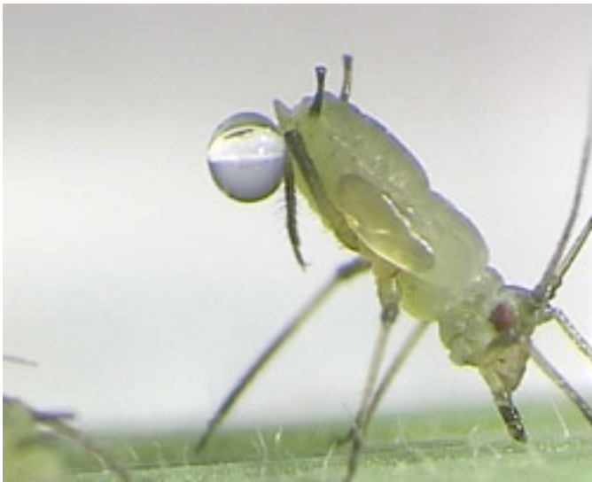
Eine Larve gibt einen Tropfen Honigtau ab und schleudert ihn dann mit dem Hinterbein fort.