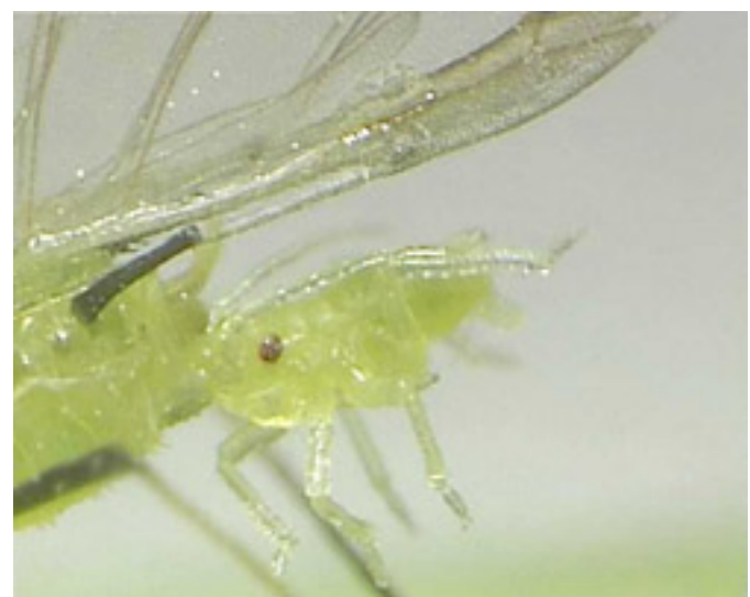
Das neue Mitglied der Kolonie, genetisch identisch mit seiner Mutter