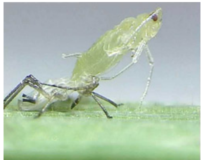
... die Exuvie ist beinahe abgestreift.